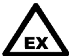
Zona con riesgos de atmósferas explosivas